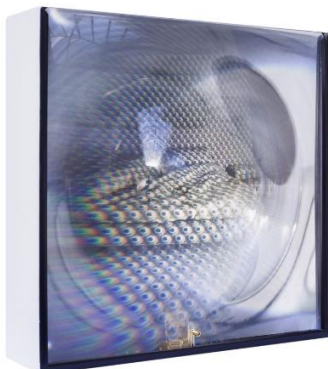
Кирил Чолаков (1964)