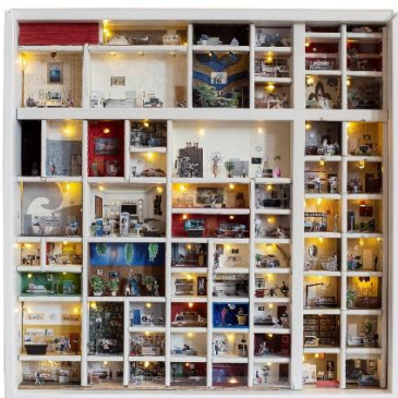
Мойра Ричи (1977)