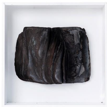
Бистра Лешевалие (1953)