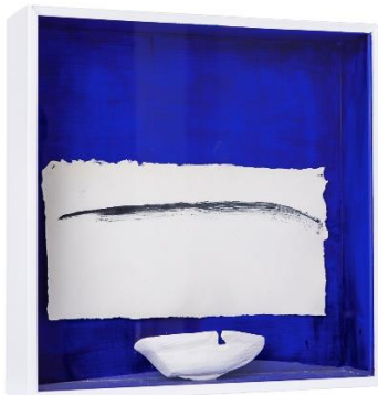
Кейт Ван Хоугън (1940)