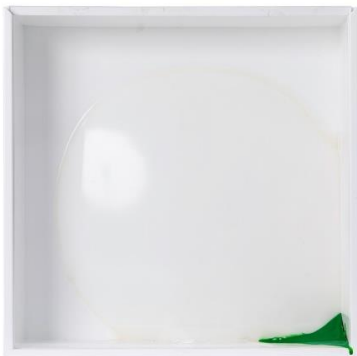
Такесада Мацутани (1937)